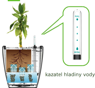
kazatel hladiny vody