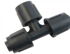
LOCK závitový T-kus