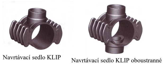
Navrtávací sedlo KLIP