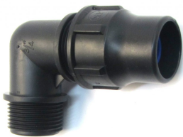
LOCK závitové koleno