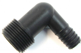
Spirálová spojka "16" koleno

V systému navrtávacích sedel si můžete vybrat z navrtávacích sedel ve velikostech 25x1/2", 32x3/4", 40x3/4" a oboustranné 32x3/4". Ve stejných dimenzích můžete najít i navrtávací sedla KLIP, která jsou jednoduchá a praktická bez použití šroubků